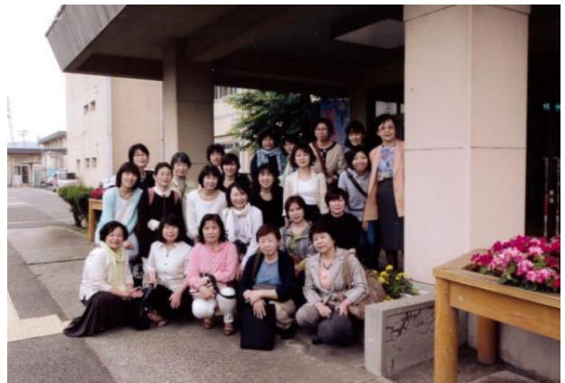
◆奈良県立ろう学校を見学◆

【連絡先】 奈良市ボランティアインフォメーションセンター TEL:0742-93-8435