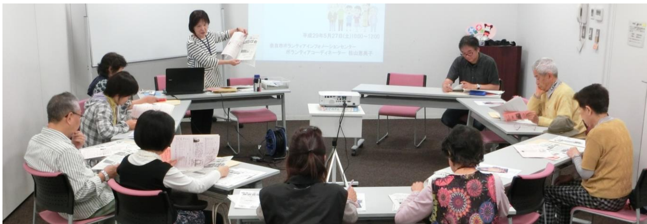
※この写真は、国内で新型コロナウイルス感染者が発生する以前に開催した過去の講座の様子です