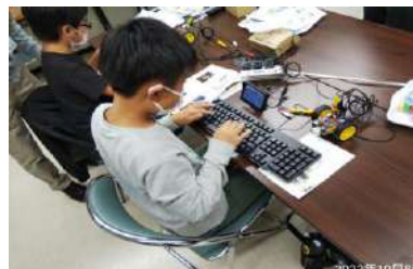
《小学生向けロボットカーの製作とプログラミング教室》