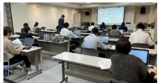
《住民向けパソコン教室(スマホ教室) 初級～中級》

【備考】《年会費》正会員:6,000円 個人会員:2,000円 賛助団体:50,000円