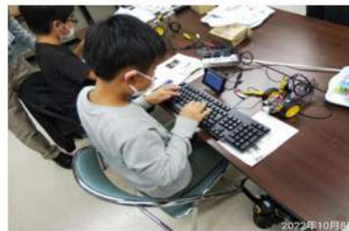
《小学生向けロボットカーの製作とプログラミング教室》